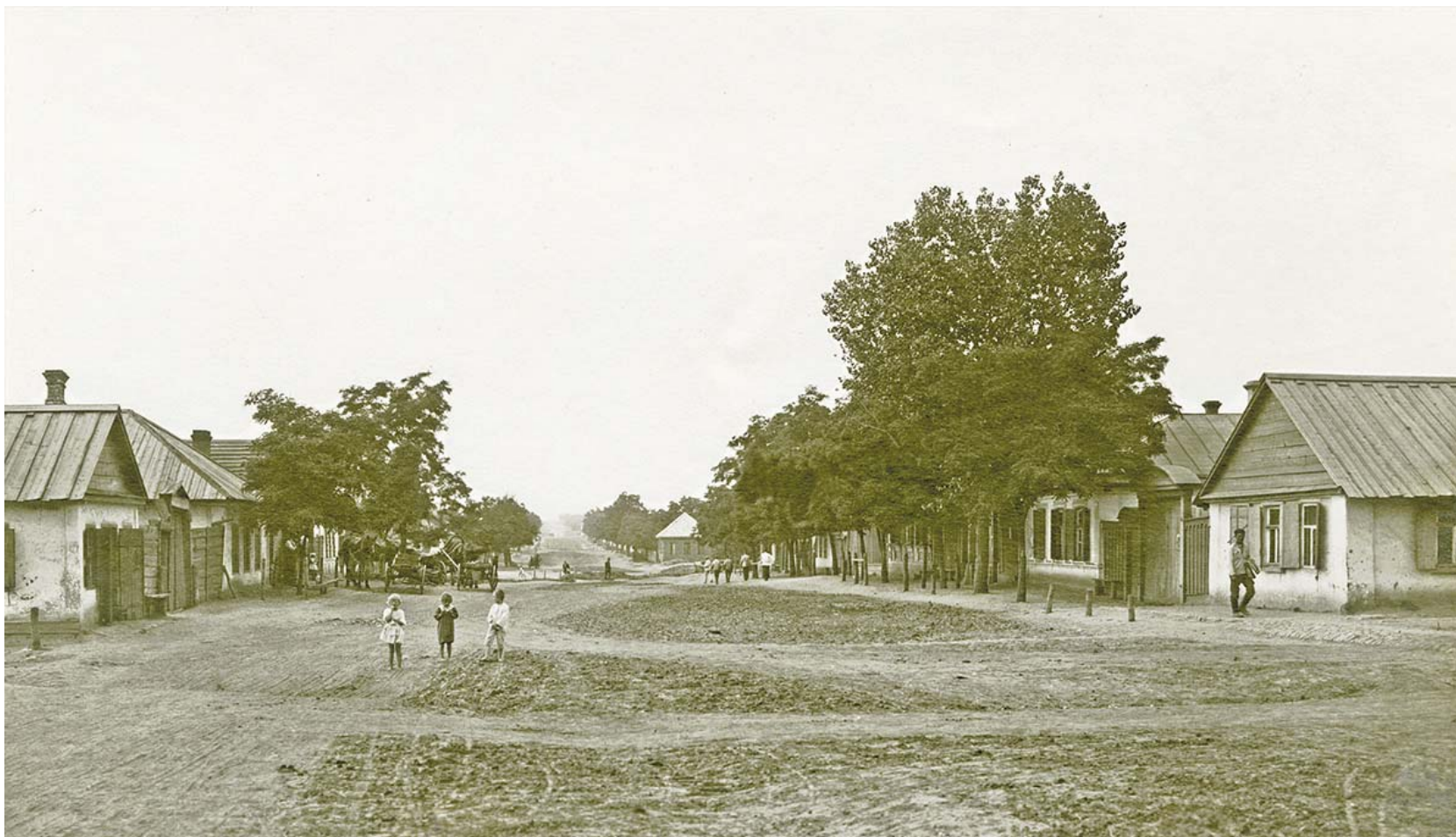
Илл. 3. Перспектива Кузнецкой (Кузнечной) улицы. 1919 г. Фотография сделана от 2-го переулка; на снимке можно рассмотреть мостик через пересекавшую улицу балку Малой Черепахи.