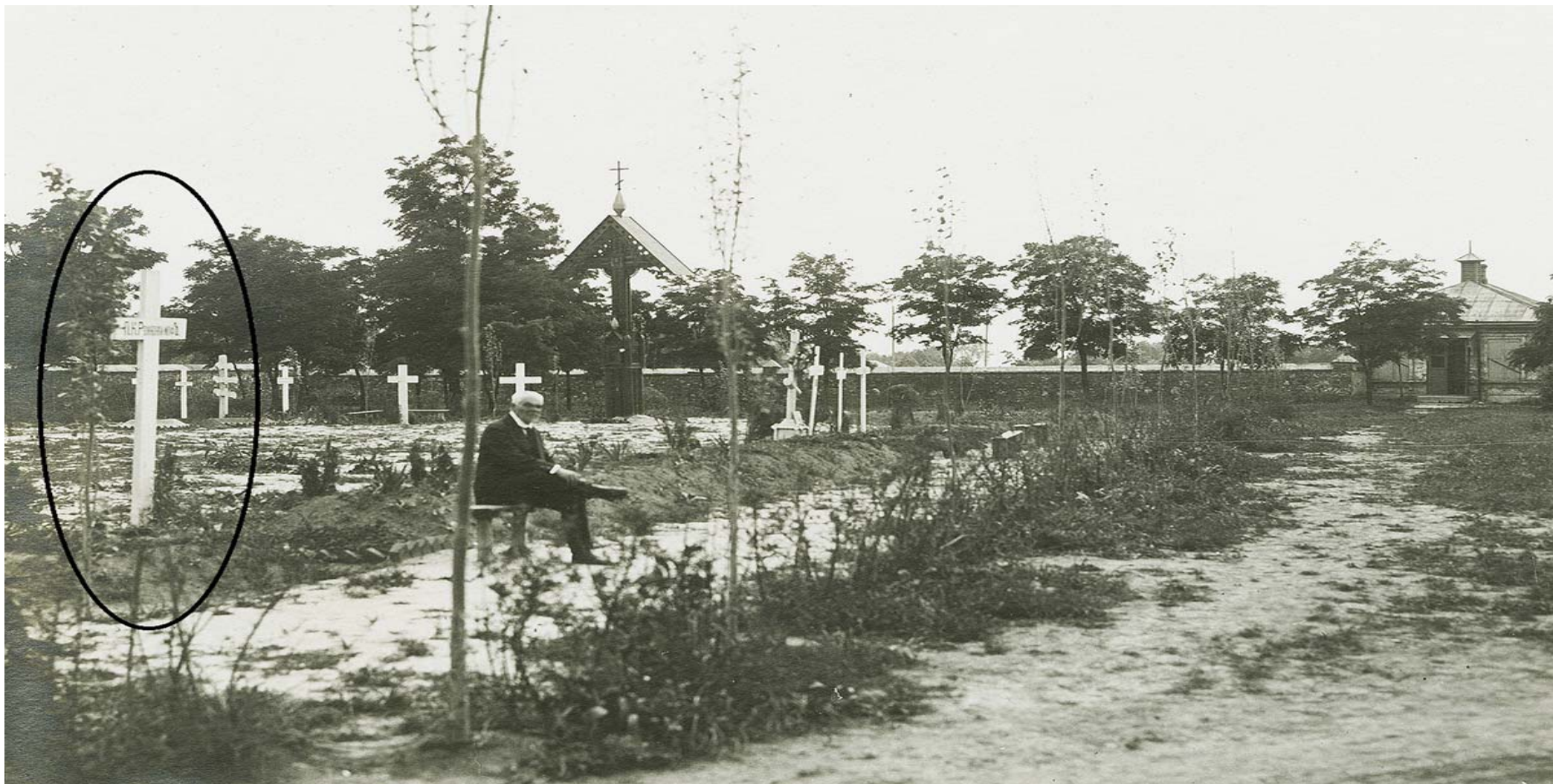
Илл. 1. Юго-западная часть Старого христианского кладбища. Братское захоронение юнкеров, офицеров и добровольцев, погибших в Таганроге в январе 1918 г. Слева на первом плане – могила генерала П.К. Ренненкампфа.